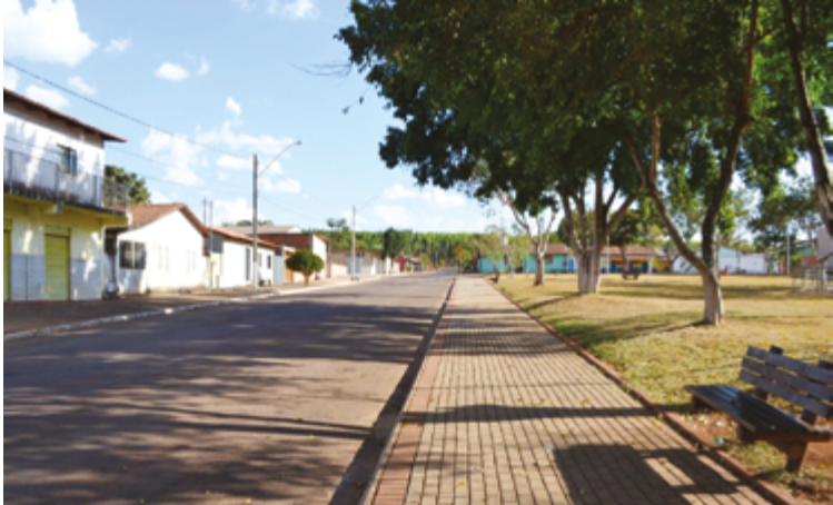
Em Goialândia, diz vereador, há torre de uma empresa, mas sinal não existe