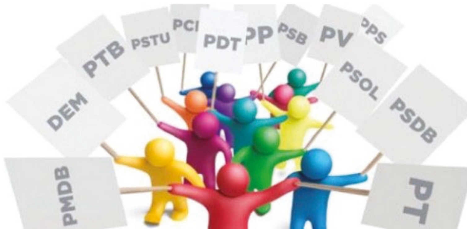
Os presidentes partidários são os que irão cuidar da “política invisível” aos olhos do eleitor; dos 25 partidos em Anápolis, 40% são geridos por quem tem mandato