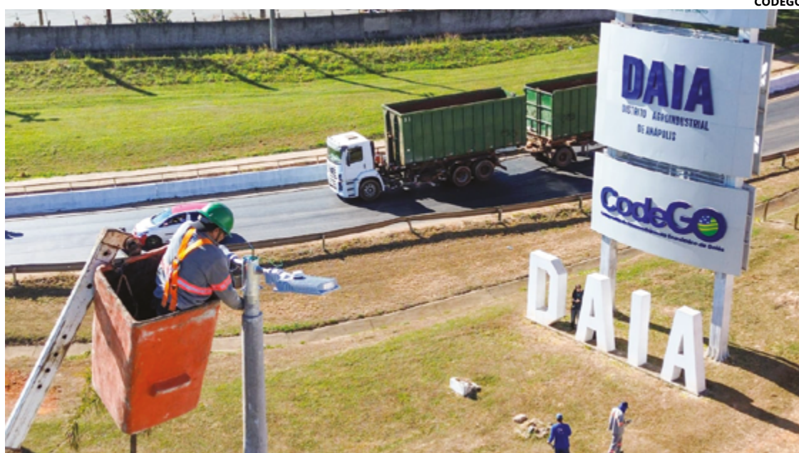
Companhia de Desenvolvimento Econômico de Goiás informa que obras serão concluídas ainda em junho

Além disso, novos postes estão sendo instalados na rodovia e a equipe tem realizado, também, a desmontagem das luminárias antigas com a substituição por opções mais