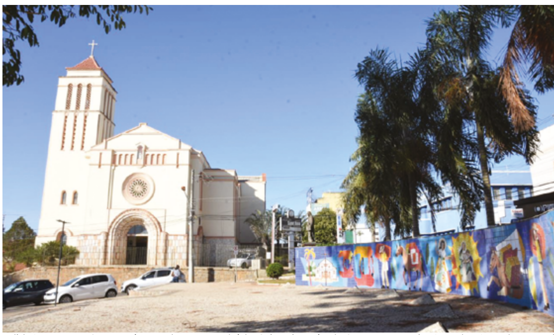
Exibição na Praça Santana é parceria entre Território Cultural, Paróquia Santana e Fundação Frei João Batista Vogel

O filme que será exibido é um clássico do cinema estadunidense. A história de Dirty Dancing se passa no verão de